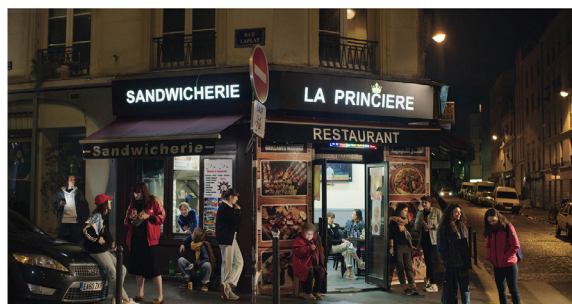
Les Intruses , color photographs and video (6 min), 2018 – 2019. Place Houwært, 80 x 120 cm, produced by Moussem Nomadic Arts Centre, Brussels.

🎬 https://www.randamaroufi.com/works/les-intruses-2/