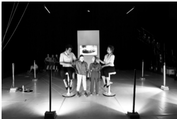
Extrait du spectacle, épisode 2 « Duty-Free »