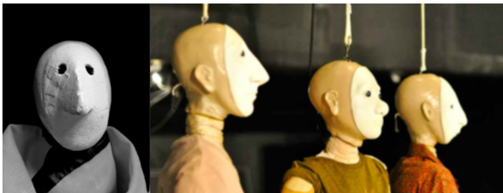
Marionnette de la saison 1 / Marionnettes de l'épisode 1 de la Saison 2

Les Présomptions* sont une série théâtrale, dont la saison 1 a été présentée au Mouffetard en 2018 et en 2020. Dans cette deuxième saison, nous retrouvons donc les mêmes personnages, dix ans plus tard. Les adolescents qui s'ennuyaient et traînaient dans la ville sont désormais des trentenaires. Nous les retrouvons dans un aéroport international, où des tranches de vie se succèdent.