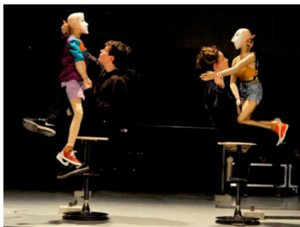
Séance de travail, épisode 2 « Duty-Free »

La différenciation des voix s'appuie sur la parfaite connaissance du caractère, des enjeux et rythmes de chaque personnage par les interprètes, plutôt que sur des variations d'intonation et de timbre.